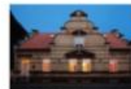
Roskilde syd Rotary Klub